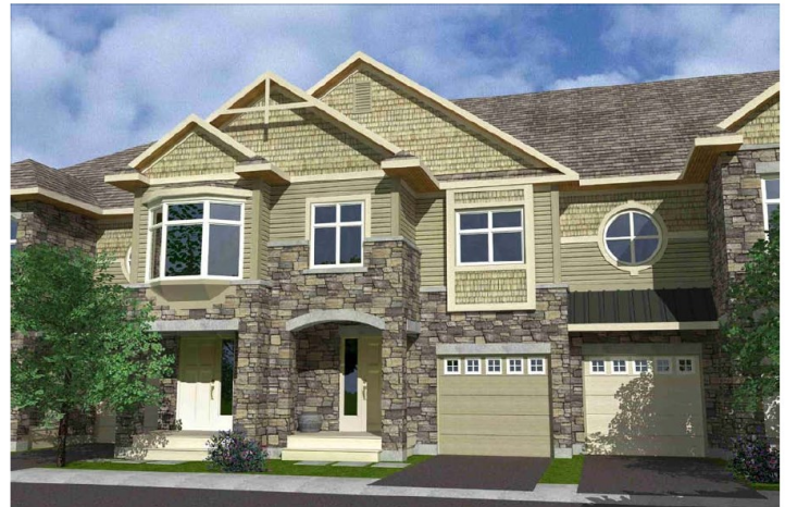
Rendering of Proposed Development / Rendu de développement proposé

The City's Planning Department has recently received a formal zoning bylaw amendment application for 890 Greenbriar Avenue. The applicant wishes to rezone the site to allow for the development of two townhouse blocks comprising of nine total units. The proposal is a mirror image with similar architectural style to the existing townhouse development on Montauk Private. Each unit is to have an attached garage for one vehicle and vehicular access via the existing Montauk Private.