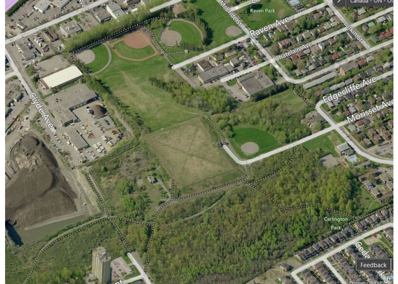
Vue aérienne de la colline du parc Carlington et des terrains de balle

Riley Brockington Le conseiller municipal du quartier Rivière 613-580-2486