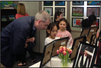
Tour de la collection dans le cadre de l’exposition Artrageous, une vente d’œuvres d’art créées par des élèves de la St. Elizabeth School organisée tous les ans en mai dans l’école.