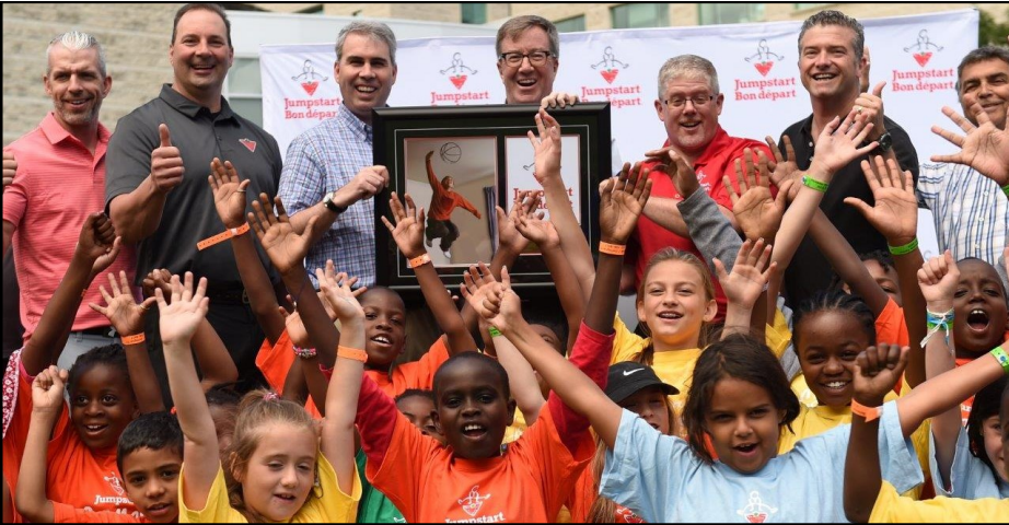
Les enfants du programme Bon départ du Centre familial Caldwell se sont joints à moi pour le lancement du programme Bon départ de Canadian Tire, qui avait lieu le 19 juillet 2016 à l’hôtel de ville.