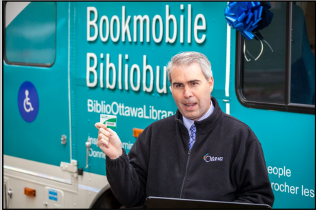
Je montre ma carte de bibliothèque lors de l’inauguration du nouveau Bibliobus de l’avenue Caldwell (octobre 2016).