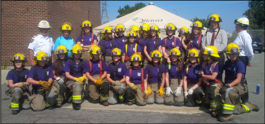
Avec la promotion sortante du Camp FPEF – Femmes pompières en formation, qui vise à encourager les jeunes femmes à envisager une carrière dans la lutte contre les incendies (août 2016).